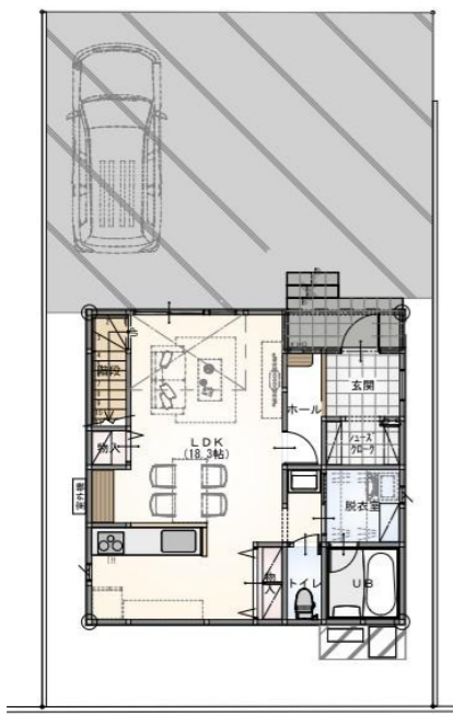
1階 平面図 S:1/100